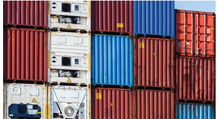
Contenedores de transporte